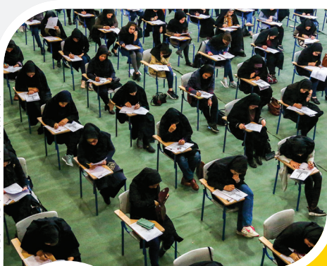
تصویری از برگزاری آزمون های مفهومی و مهارتی وکالت