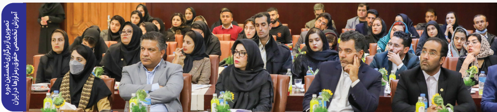
تصویری از برگزاری نخستین دوره آموزشی تخصصی حقوق برای روزها در ایران