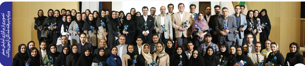
تصویری از برگزاری آمایش صفر و ویژه برنامه مسابقات آزمون وکالت