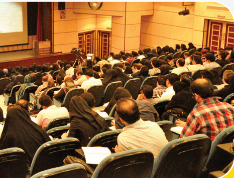
تصویری از بزرگترین کلاس حقوق جزابه شیوه مفهومی و رمزنگاری با تدریس استاد قاضی زاده